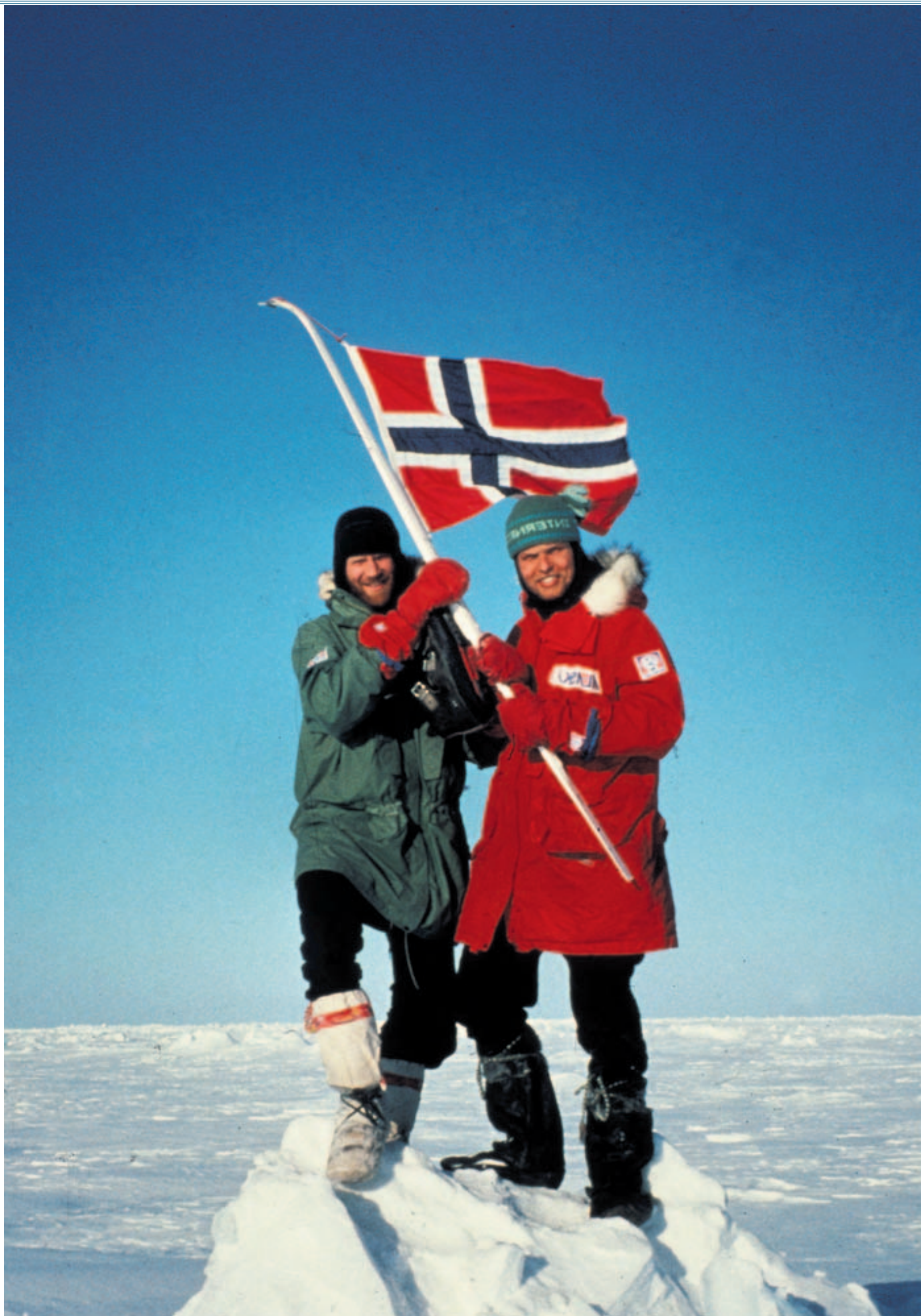
DE FØRSTE: Børge Ousland (t.v.) og Erling Kagge feirer seieren ved Nordpolpunktet. 57 dagers umenneskelig slit er over. Det gikk flere døgn før de kunne hentes ut med fly.