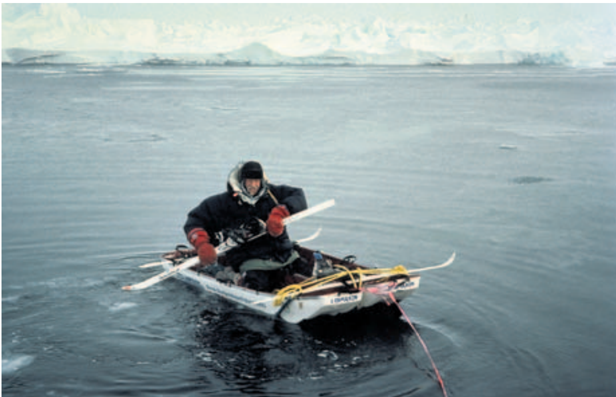
FERJETRAFIKK: Åpne råker måtte krysses ved hjelp av pulkene som ble bundet sammen til en klumpete kano. Børge Ousland i aksjon med ski som padleåre.

De har akkurat stoppet for å slå leir. Den står 15-20 meter unna. Ousland leter etter revolveren sin, en Magnum 44. det samme gjør Kagge.