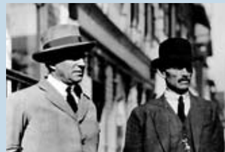
OVER-TOK: Oscar Wisting (t.v.) og Helmer Hanssen i Tromsø i 1928.