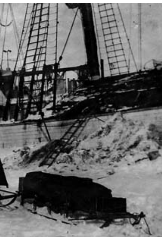
NØDUTGANG: Tre sleder med det mest nødvendige – proviant for 40 dager, en seilduksbåt, to telt og soveposer – sto alltid klare på isen i tilfelle isskruingen skulle felle «Maud».