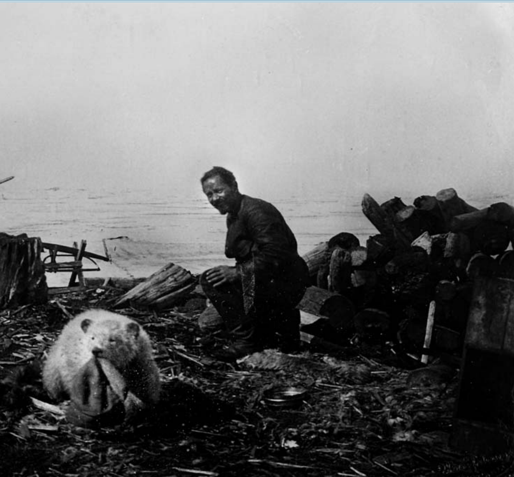
mannskapet temmet. Bildet er antakelig tatt i 1922. Sverdrup bergte ekspedisjonens ettermøte med sine vitenskapelige resultater.