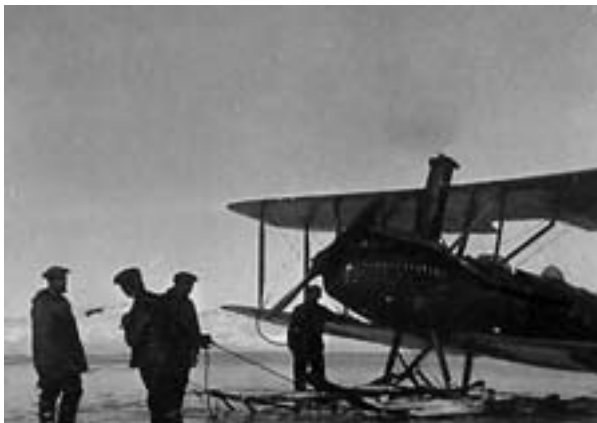
HAVARI: Den nye tids teknologi, flyet, skulle utnyttes. Det gikk fullstendig galt.